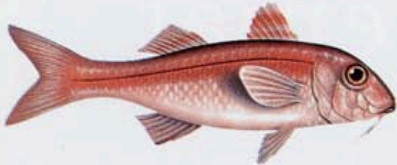
Moll Talla mínima 11 cm →