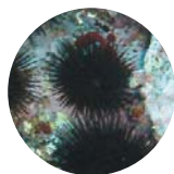
Paracentrotus lividus 5 cm