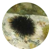
Arbacia lixula 5 cm